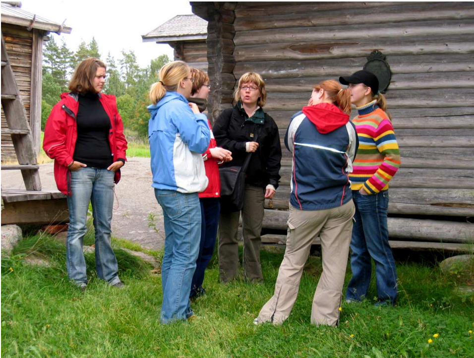
Rural Studies -johdantokurssi Ristiinassa vuonna 2005 tutustuttiin Pien-Toijolan talomuseoon.