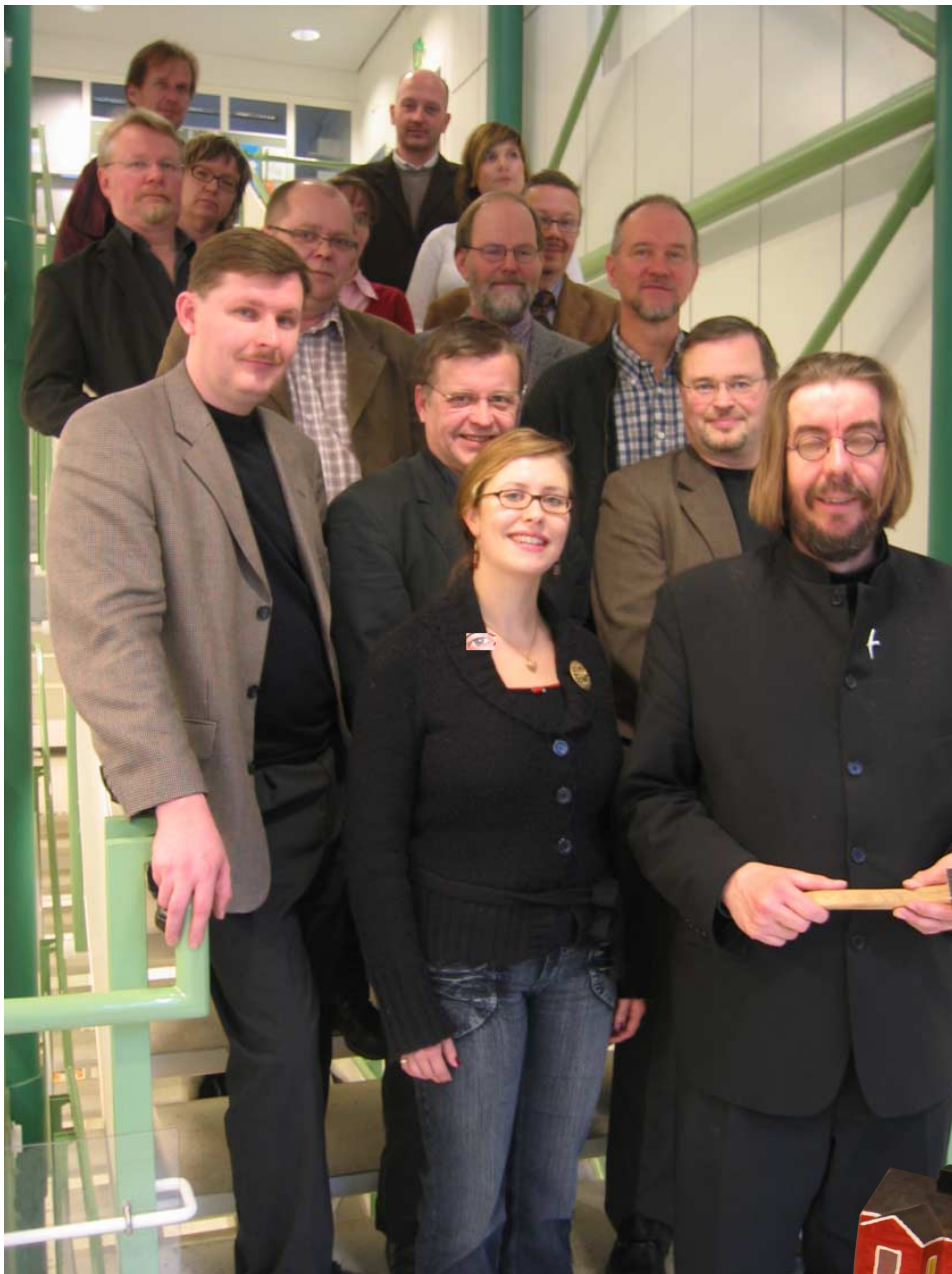
Rural Studies -johtokunta kokoontui Tampeereella 1.12.2006